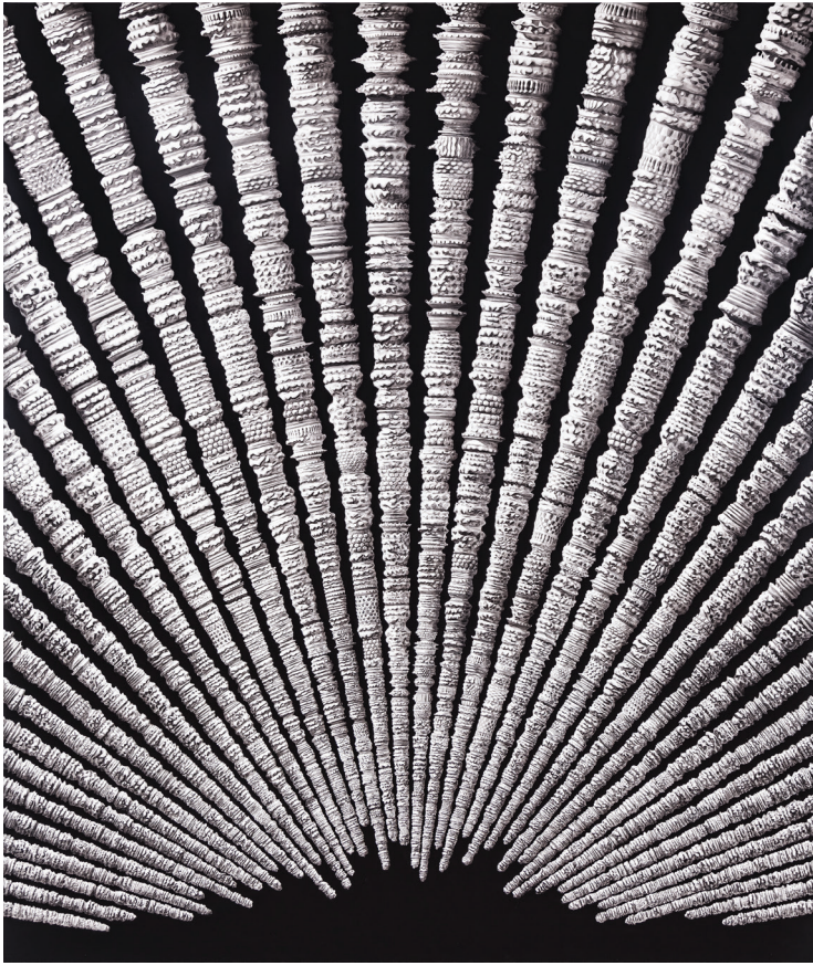
Residues of time - 170x200 cm -