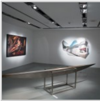
"ÖZERK VE ÇOK GÜZEL" SERGİSİ, AKBANK SANAT