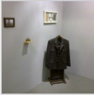
ÇAĞRI SARAY, "MUTSUZ HAZIR NESNE" SERGİSİ, KUAD GALLERY