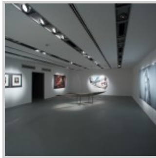
"ÖZERK VE ÇOK GÜZEL" SERGİSİ, AKBANK SANAT