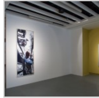
"ÖZERK VE ÇOK GÜZEL" SERGİSİ, AKBANK SANAT